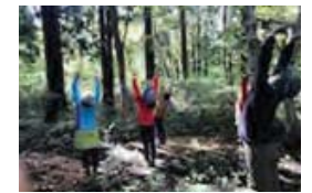
多様な地域資源を新分野で活用