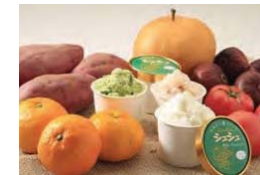
農産物を利用した新商品開発