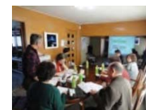
地域の活動計画の策定 （ワークショップの開催）