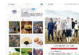
WebサイトやSNSによる 優良事例の情報発信