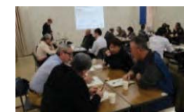
農山漁村の多様な活動への参加