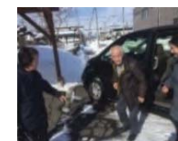
体制構築及び実証活動 （高齢者の移動確保）