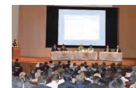
農業農村の多様な価値の理解醸成