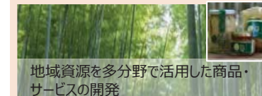
地域資源を多分野で活用した商品・サービスの開発