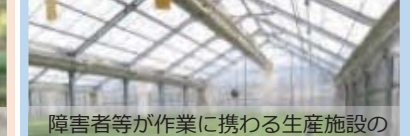
障害者等が作業に携わる生産施設の整備