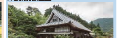
古民家等を活用した滞在型施設の整備