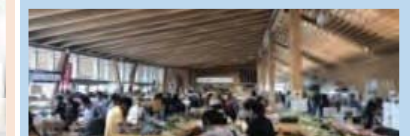
農産物直売所の整備