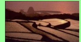
中山間地域 (山口県長門市)

中山間地域等において、農業生産条件の不利を補正することにより、将来に向けて農業生産活動を維持するための活動を支援