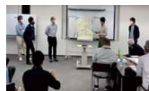
持続的な経営を担う森林プランナー育成支援