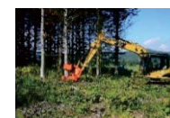
高性能林業機械導入支援