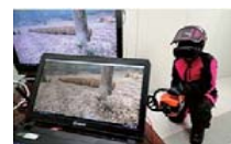
林業労働災害防止の支援