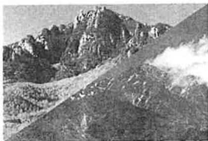
(瑞牆山・甲斐駒ヶ岳)