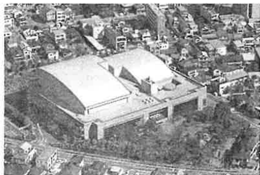
（YCC 県民文化ホール 外観）