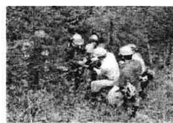
林業を志す人への研修