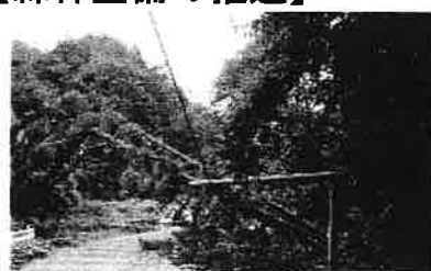
倒木により電線断線