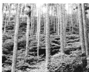
間伐により倒木を防止