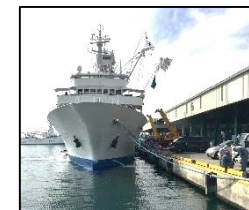
耐震強化岸壁等の施設の地震・津波対策