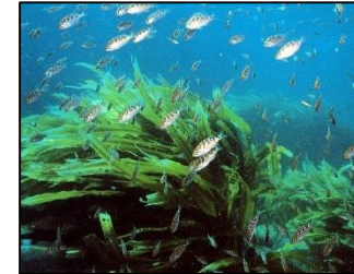
資源管理と連携した広域的な水産環境の整備