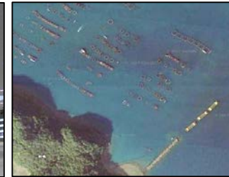
大規模養殖の展開を可能にする静穏水域等の造成