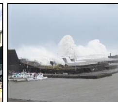
台風・低気圧災害に備えた漁港施設の耐浪化の推進