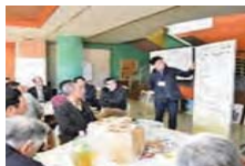
地域活性化のための活動計画づくり (※)

地域活性化のための活動計画づくりや農山漁村の地域資源を活用し、新たな価値を創出する取組等を支援します。