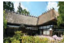
古民家等を活用した滞在型施設の整備