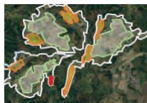
土地利用構想の作成