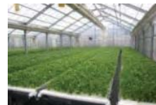
障害者等が作業に携わる生産施設の整備等