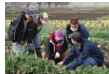
障害者等の農産物栽培技術の習得等