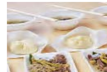
山菜を利用した商品開発