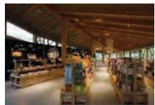
農産物加工・販売施設の整備