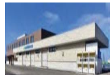
集出荷・貯蔵・加工施設の整備