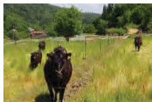
農地の粗放的利用