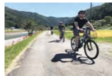
景観等を利用した高付加価値コンテンツの開発