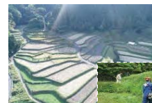
農村RMOによる農用地保全