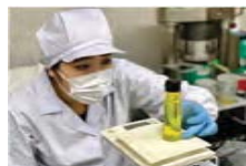
地域資源を活用した新商品開発