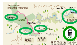
通話可能エリアマップの整備