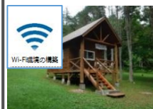
ワーケーション環境の整備 (Wi-Fi整備)