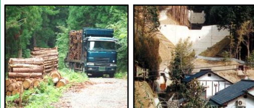
林道等の整備により効率的な間伐材等の搬出を実現 治山施設による山地災害の未然防止