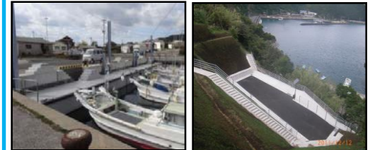
漁業作業の効率化と安全対策のための漁港整備（岸壁改良） 漁村における津波避難対策（避難地、避難路の整備）