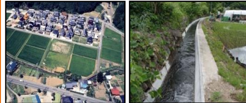
ほ場整備による農業生産性の向上と秩序ある土地利用の推進 老朽化した用水路の整備・更新と秩序ある土地利用の推進