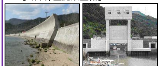
津波、高潮による被害を未然に防ぐため海岸堤防の整備を推進 津波・高潮対策としての水門整備