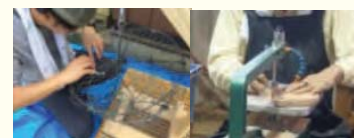
養殖籠補修・木工技術習得