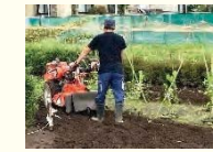
ユニバーサル農園の運用