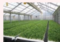
農業生産施設（水耕栽培ハウス）