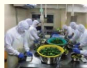
農産加工の実践研修