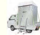
移動式トイレの導入