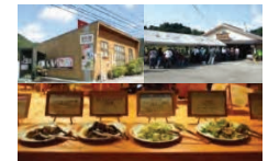
地元食材を使用したレストラン