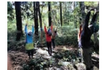
森林を利用したヒーリング事業