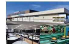
集出荷・貯蔵・加工施設