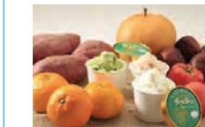
農産物を利用した新商品開発