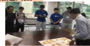
《専門家を招いたワークショップ》