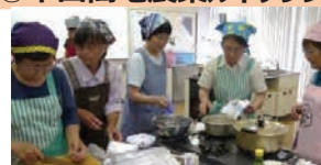
《新メニュー開発の講習会》