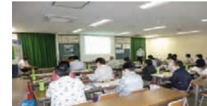
《農薬使用に関する研修会》