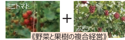
《野菜と果樹の複合経営》