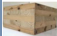
建築用木材の開発