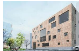
CLTを活用した街づくりの実証

※ BIM(Building Information Modeling)…コンピュータ上で部材の仕様等の様々な属性情報を併せ持つ3次元の建築物のモデルを構築するシステム