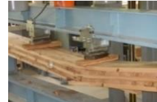
部材のデータ収集