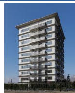
都市の木造化に向けた取組

都市部における 建築用木材（木質耐火部材等を含む）の利用実証 の対象に設計者を追加するとともに、 改正木材利用促進法に基づく協定締結者 を優先的に支援します。また、 大径材活用も踏まえた地域材による設計合理化等の技術開発・普及 や 強度等に優れた建築用木材の製造に係る技術の開発・大学等と連携した普及 を支援します。さらに、川上から川下までが連携した顔の見える木材を使用した 構造材、内装材、家具・建具等の普及啓発 や、 製材工場等の品目のバリエーションの充実 に資する取組を支援します。