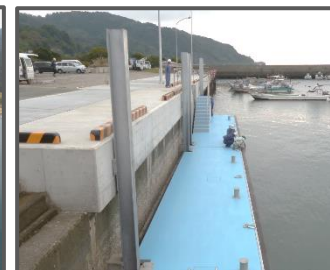
魅力ある漁村の形成 陸揚げの軽劣化に資する浮体式係船岸の整備