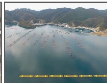
大規模養殖の展開を可能にする静穏水域の創出