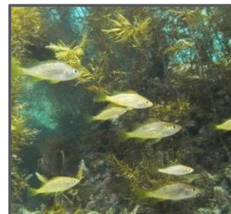
幼稚仔魚の生育の場となる藻場の整備