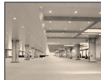
流通機能強化、衛生管理に対応した荷さばき所の整備