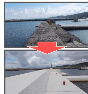
施設の長寿命化対策