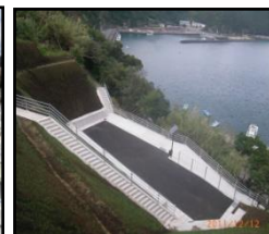
漁村における津波避難対策のための津波避難対策（避難地、避難路の整備）