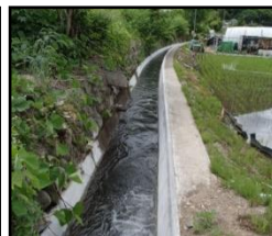
老朽化した用水路の整備・更新