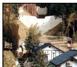
治山施設による山地災害の未然防止