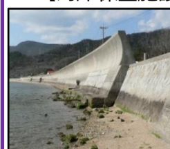
津波、高潮による被害を未然に防ぐため海岸堤防の整備を推進