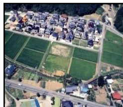
ほ場整備による農業生産性の向上と秩序ある土地利用の推進