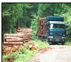
林道等の整備により効率的な間伐材等の搬出を実現