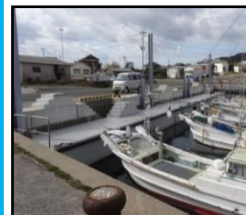
漁業作業の効率化と安全対策のための漁港整備（岸壁改良）