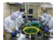
農産加工の実践研修