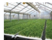
農業生産施設 (水耕栽培ハウス)