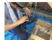
養殖籠補修・木工技術習得