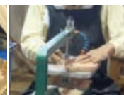
作業マニュアル作成