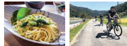
地元食材・景観等を活用した高付加価値コンテンツの開発