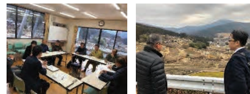
課題に応じた専門家の派遣・指導