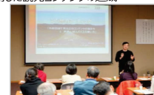
専門家の派遣・指導