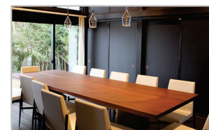
食の高付加価値化に不可欠な内装・遊休資産を活用した施設の整備