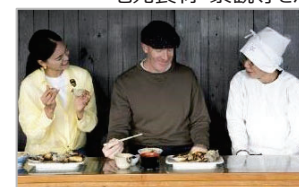
インバウンド向け食コンテンツの造成