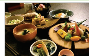
地元食材・景観等を活用した観光コンテンツの造成