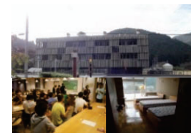
廃校を利用した交流施設