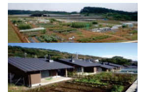
農作業の体験施設