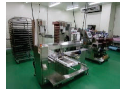
農林水産物処理加工施設