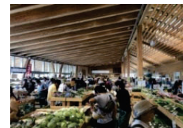
農林水産物直売所