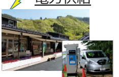
EV車等への給電設備