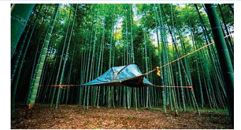
竹林の景観を活かした キャンプ事業の創出