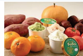
地域の農林水産物で 新商品を開発