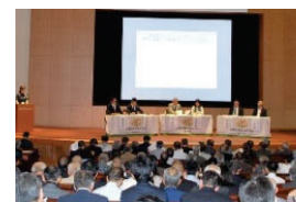
農業農村の多様な価値の理解醸成

農村振興局都市農村交流課（03-6744-1855） 農村計画課（03-3502-6001） 鳥獣対策・農村環境課（03-6744-0250）