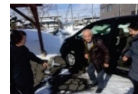
体制構築及び実証活動 （高齢者の移動確保）