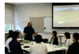
農村プロデューサー養成講座（対面講義） （講師による講義）