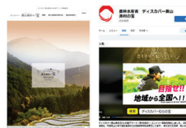
WebサイトやSNSによる 優良事例の情報発信