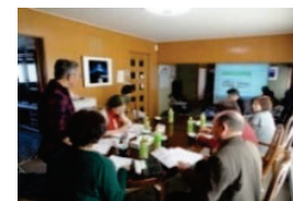
地域の活動計画の策定 （ワークショップの開催）