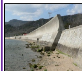
津波、高潮による被害を未然に防ぐため海岸堤防の整備を推進