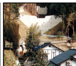
治山施設による山地災害の未然防止