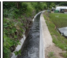
老朽化した用水路の整備・更新