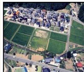
ほ場整備による農業生産性の向上と秩序ある土地利用の推進