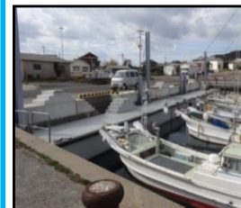
漁業作業の効率化と安全対策のための漁港整備（岸壁改良）