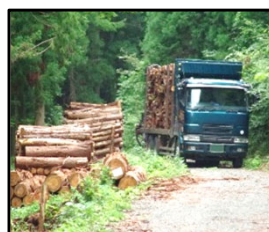
林道等の整備により効率的な間伐材等の搬出を実現