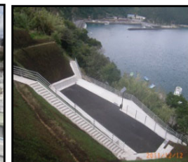
漁村における津波避難対策（避難施設、避難経路の整備）