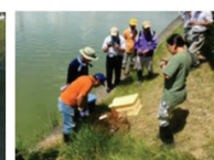
ため池の外來種駆除

実施主体：農業者等で構成される組織（①及び③は農業者のみで構成する組織でも取組可能）