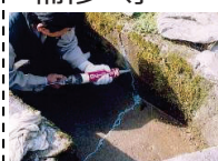
水路のひび割れ補修