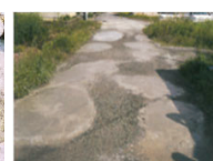
農道の窪みの補修