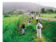
農地法面の草刈り