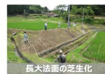
【農用地保全の実証的な取組】