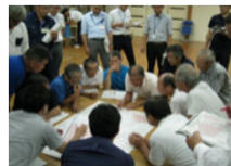
【地域ぐるみの話し合い】

地域ぐるみの話し合いにより、営農を続けて守るべき農地、粗放的な利用を行う農地等を区分し、実証的な取組を実施