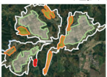
【土地利用構想の策定】