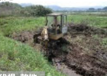
【粗放的利用のための条件整備】