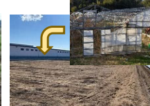
【荒廃農地の支障物撤去】