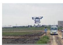
【省力化機械の導入】