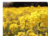
【蜜源作物等の作付け】