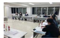
合意形成・計画づくり

住民意向調査、地域住民によるワークショップ開催 資源活用の推進体制・組織の整備、実施計画づくり 等