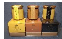
地域産品の加工・商品化

地域資源（農林水産物等）を使った地域産品づくり※ 観光体験プログラム開発、モニターツアー実施 既存の直売所等と連携した販売促進、地域ブランドづくり 商品パッケージ等のデザイン検討、ECサイトの立ち上げ 等 ※商品の製造加工を非振興山村地域で行うことも可能