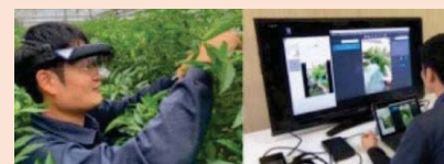
《栽培技術のeラーニング》