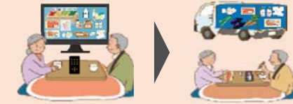
《テレビ画面で買い物支援》