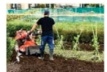
ユニバーサル農園の開設