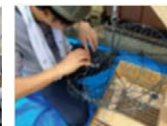
養殖籠補修・木工技術の習得