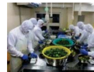
農産加工の実践研修