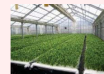
農業生産施設(水耕栽培ハウス)