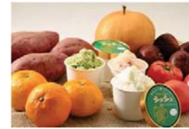
農林水産物を利用した新商品開発