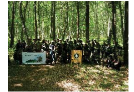
多様な地域資源を新分野で活用