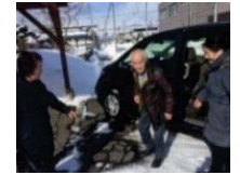
体制構築及び実証活動 （高齢者の移動確保）