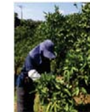
農山漁村の多様な活動への参加