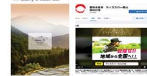
WebサイトやSNSによる 優良事例の情報発信