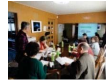
地域の活動計画の策定 （ワークショップの開催）