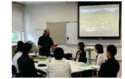
農村プロデューサー 養成講座の風景