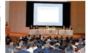
農業農村の多様な価値の理解醸成