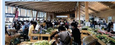
農林水産物直売所の整備