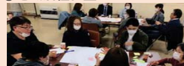
地域住民による地域活性化のための活動計画づくり