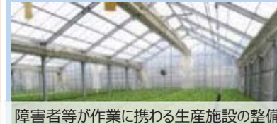
障害者等が作業に携わる生産施設の整備