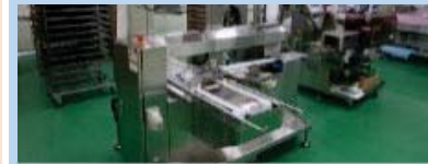
農林水産物処理加工施設の整備