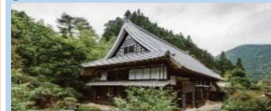
古民家等を活用した滞在型施設の整備