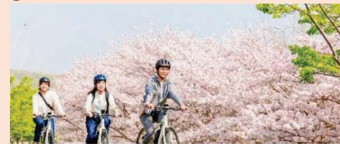
景観等を活用した観光コンテンツの開発