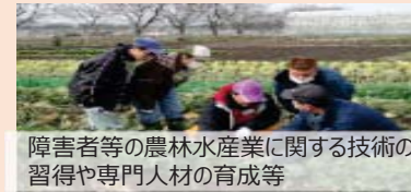
障害者等の農林水産業に関する技術の習得や専門人材の育成等