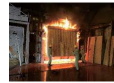
強度や耐火性に優れた建築用木材の技術開発