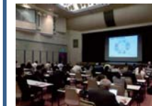
木造建築の設計者・施工者の育成