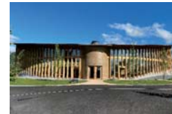
都市部における建築用木材の利用実証