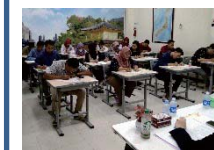
外国人材受入れのための試験実施