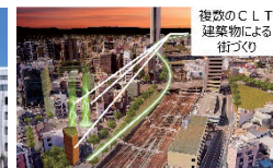
複数のCLT建築物による街づくり