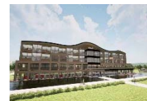
用途タイプ別の木造標準モデルの開発