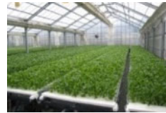
障害者等が作業に携わる生産施設の整備