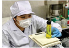
地域資源を活用した新商品開発