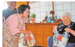
農村RMOによる生活支援

複数集落の機能を補完する農村型地域運営組織（農村RMO）の形成、収益力向上や販売力強化等に関する取組、デジタル技術の導入・定着を推進する取組を支援します。