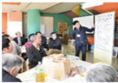
地域活性化のための活動計画づくり※