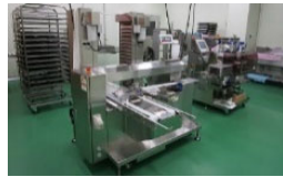
農林水産物処理加工施設の整備