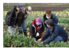
障害者等の農林水産業に関する技術の習得