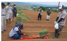
高収益作物の導入