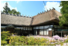
古民家等を活用した滞在型施設の整備