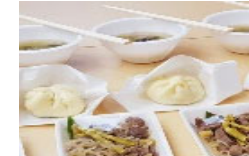
山菜を利用した商品開発