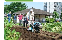
都市農地貸借による担い手づくりへの支援