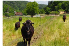
農地の粗放的利用