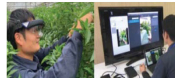
栽培技術のeラーニング