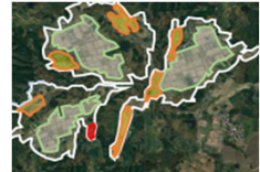
土地利用構想の作成