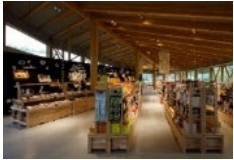
農林水産物販売施設の整備