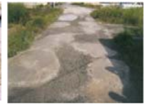
農道の窪みの補修