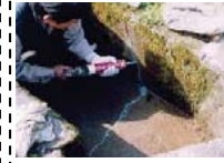
水路のひび割れ補修