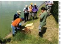
ため池の外來種駆除

実施主体：農業者等で構成される組織（①及び③は農業者のみで構成する組織でも取組可能） 対象農用地：農振農用地及び多面的機能の発揮の観点から都道府県知事が定める農用地