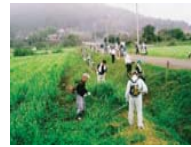
農地法面の草刈り