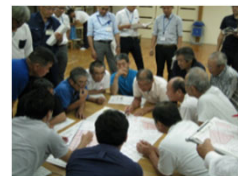
【地域ぐるみでの話し合い】

地域ぐるみの話し合いにより、営農を続けて守るべき農地、粗放的な利用を行う農地等を区分し、実証的な取組を実施