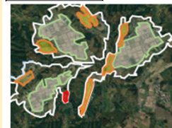
【土地利用構想の策定】