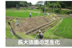
【農用地保全の実証的な取組】