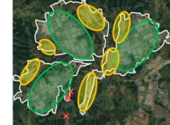
【土地利用構想の概定】