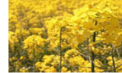
【蜜源作物の作付け】