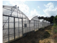
【農業用ハウスの整備】