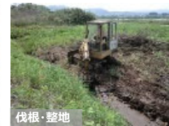
【粗放的利用のための条件整備】