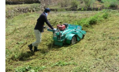
【省力化機械の導入】