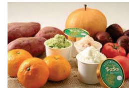
農林水産物を利用した新商品開発