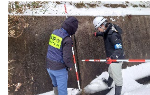
激甚災害後の治山施設の点検支援