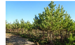
海岸防災林の密度管理に係る支援強化