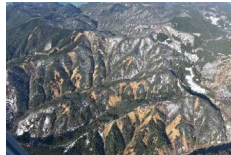
能登半島地震で発生した多数の山腹崩壊