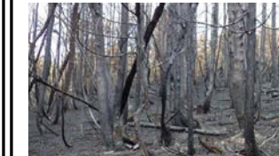
森林の機能が低下した山火事跡地