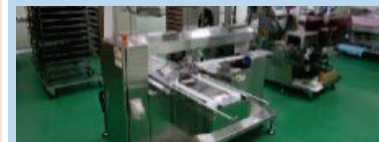
農林水産物処理加工施設の整備