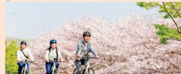
景観等を活用した観光コンテンツの開発