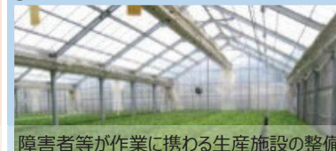
障害者等が作業に携わる生産施設の整備