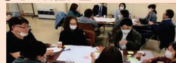
地域住民による地域活性化のための活動計画づくり