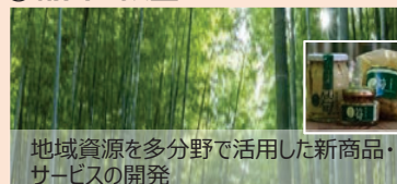
地域資源を多分野で活用した新商品・サービスの開発