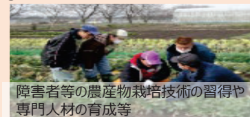
障害者等の農産物栽培技術の習得や専門人材の育成等