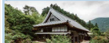
古民家等を活用した滞在施設の整備