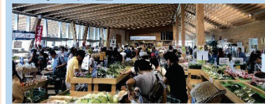
農林水産物直売所の整備