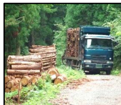
林道等の整備により効率的な間伐材等の搬出を実現