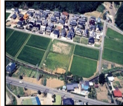
ほ場整備による農業生産性の向上と秩序ある土地利用の推進