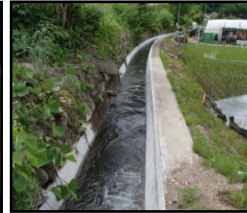
老朽化した用水路の整備・更新