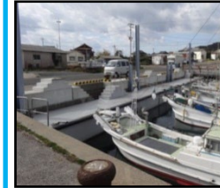
漁業作業の効率化と安全対策のための漁港整備（岸壁改良）