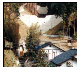
治山施設による山地災害の未然防止