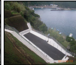
漁村における津波避難対策（避難施設、避難経路の整備）