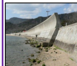
津波、高潮による被害を未然に防ぐため海岸堤防の整備を推進