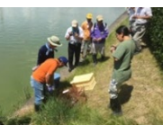
ため池の外來種駆除

実施主体：農業者等で構成される組織（①及び③は農業者のみで構成する組織でも取組可能） ※一定の要件を満たす場合、土地改良区及び農業法人が実施主体になることを可とする。