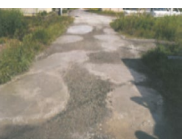
農道の窪みの補修