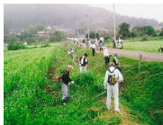
農地法面の草刈り