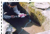
水路のひび割れ補修