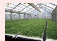
農業生産施設（水耕栽培ハウス）