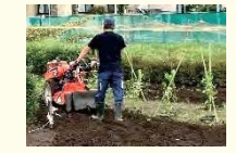
ユニバーサル農園の開設