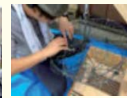
養殖籠補修・木工技術習得