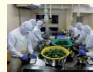
農産加工の実践研修