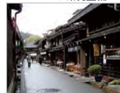
古民家等を活用した滞在施設の整備