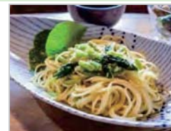
地元食材・景観等を活用した観光コンテンツの開発