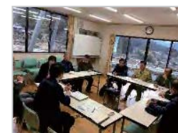
専門家の派遣・指導