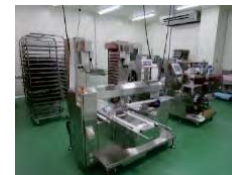
農林水産物処理加工施設