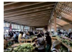
農林水産物直売所