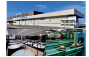
集出荷・貯蔵・加工施設