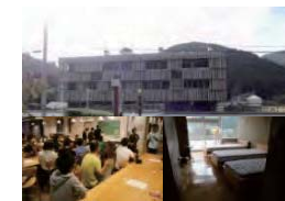
廃校を利用した交流施設