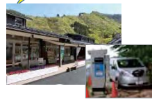
EV車等への給電設備