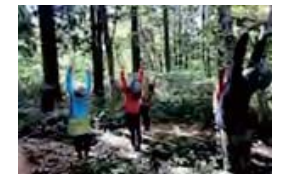
多様な地域資源を新分野で活用