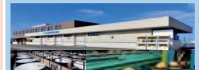
集出荷・貯蔵・加工施設の整備