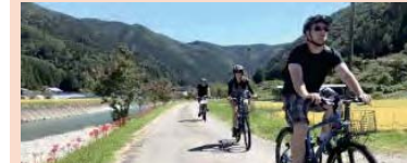
景観等を活用した観光コンテンツの開発