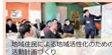
地域住民による地域活性化のための活動計画づくり