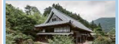
古民家等を活用した滞在型施設の整備