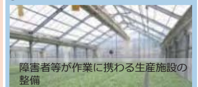
障害者等が作業に携わる生産施設の整備