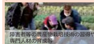
障害者等の農産物栽培技術の習得や専門人材の育成等