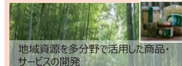
地域資源を多分野で活用した商品・サービスの開発