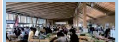
農林水産物直売所の整備