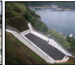
漁村における津波避難対策（避難施設、避難経路の整備）