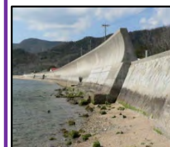
津波、高潮による被害を未然に防ぐため海岸堤防の整備を推進