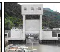
津波・高潮対策としての水門整備

（共通）切迫する南海トラフ地震、日本海溝・千島海溝周辺海溝型地震等の発生を見据えた防災インフラ整備