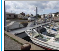
漁業作業の効率化と安全対策のための漁港整備（岸壁改良）