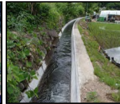
老朽化した用水路の整備・更新