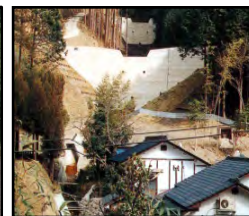
治山施設による山地災害の未然防止