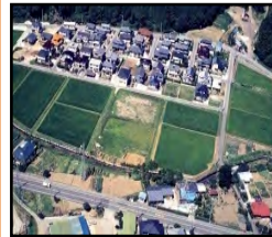
ほ場整備による農業生産性の向上と秩序ある土地利用の推進