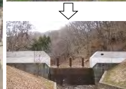
機能強化対策の強化