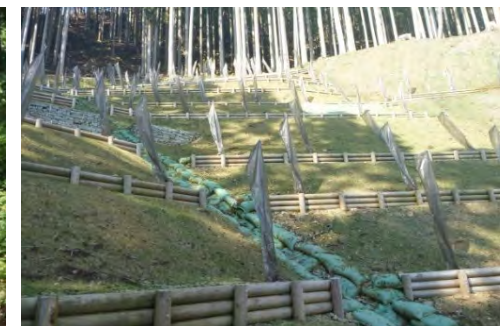
2級水系への流域治水の連携拡大とEco-DRRの強化