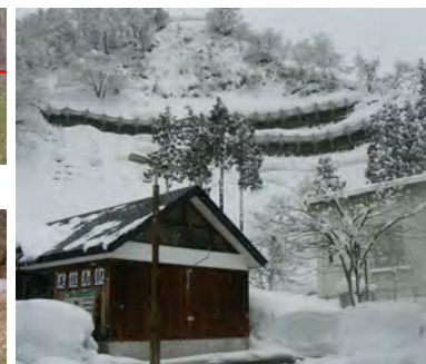
積雪地域の治山対策の強化