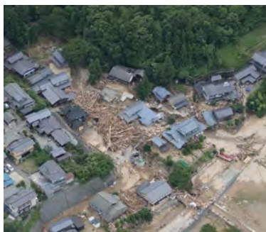
頻発・多様化する流木災害