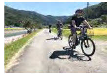
景観等を利用した高付加価値コンテンツの開発