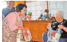
農村RMOによる買い物支援

農村RMOの形成推進、収益力向上や生活支援等に関する取組、デジタル技術の導入・定着、棚田地域等における関係人口の創出を支援します。