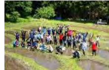
棚田地域振興活動への支援