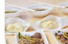
山菜を利用した商品開発