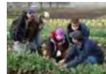
障害者等の農産物栽培技術の習得等