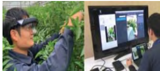
栽培技術のeラーニング