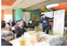
地域活性化のための活動計画づくり*

地域活性化のための活動計画づくりや農山漁村の地域資源を活用し、新たな価値を創出する取組等を支援します。