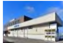
集出荷・貯蔵・加工施設の整備