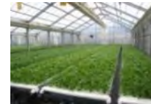
障害者等が作業に携わる生産施設の整備等