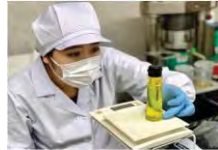
地域資源を活用した新商品開発