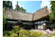
古民家等を活用した滞在型施設の整備