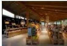
農林水産物加工・販売施設の整備