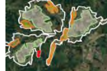
土地利用構想の作成