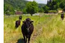
農地の粗放的利用