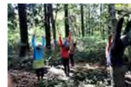
多様な地域資源を新分野で活用