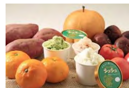
農産物を利用した新商品開発